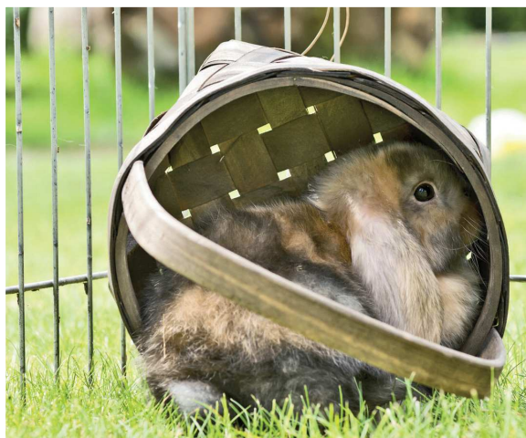
▲ L'enrichissement du milieu de vie du lapin contribue à son bien-être physique et mental.