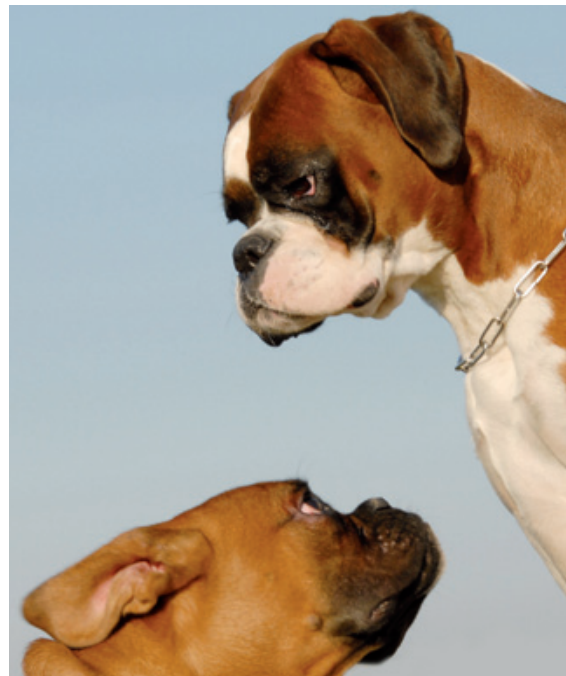
La « gentillesse » du boxer vis-à-vis des ses maîtres est ici confirmée même si des tendances à l'agressivité intraspécifique sont observées.

Race dangereuse ou pas ? Voilà une bien mauvaise manière de poser le problème, les vétérinaires doivent combattre ces idées. Les politiques y ont vu une stratégie simple : une fois les coupables désignés, quelques interdictions et le problème serait réglé. Cette méthode ne fonctionne nulle part sur la planète, et la réalité amène (enfin) les décideurs à aborder le problème dans sa complexité, dans ses paramètres individuels, et à lancer une stratégie préventive. Elle est moins spectaculaire, mais nous l'espérons payante à moyen terme pour diminuer le nombre de morsures, et en particulier celles qui touchent de jeunes enfants.