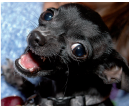
Association de malfaiteurs...

D'autres manifestent plus volontiers ces comportements vis-à-vis de congénères : Akita (près de 30 % manifestent régulièrement ce comportement), Siberian husky, « pit bull » au sens large (terriers de type bull, American Staffordshire terrier et bull terrier du Staffordshire : 22 %), berger allemand (16,4 %), border collie (13,5 %). On éliminait pour ce critère les rivalités sans grandes conséquences qui peuvent survenir entre chiens partageant le même toit. Les races les plus agressives vis-à-vis des intrus (humains) sont selon les auteurs : teckel (plus de 20 % sont coutumiers du fait), Chihuahua (plus de 16 %), doberman, rottweiler, Yorkshire terrier et caniche. A l'inverse, Labrador retriever, golden retriever, basset hound, Siberian husky, bouvier bernois, épagneul breton, lévriers en général ne sont pas d'excellents