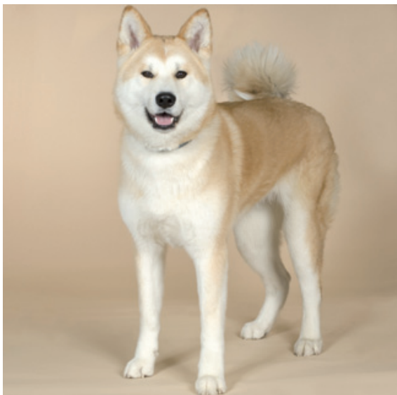
Les chiens de type primitif, comme l'Akita, manifestent plus volontiers une agressivité intraspécifique.

« gardiens » au sens où ils ne sont pas très agressifs envers les intrus.